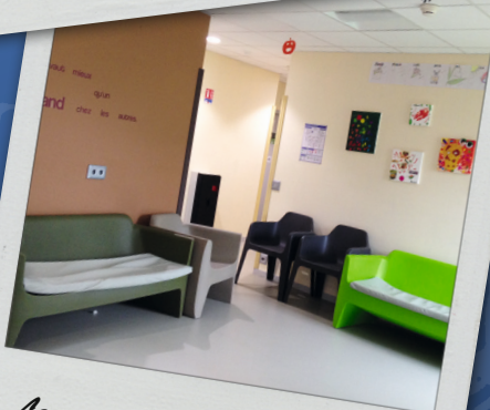
Le salon d'une Unité de Vie